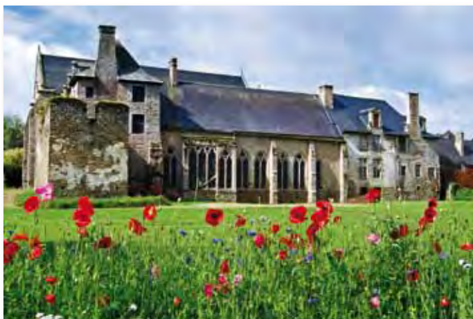
Abbaye de Léhon

Tarifs : adulte : 4€. Jeune (12 à 18 ans et étudiants) : 3€. (gratuit moins de 12 ans). Billets en vente à l'Office de Tourisme et à l'Abbaye.